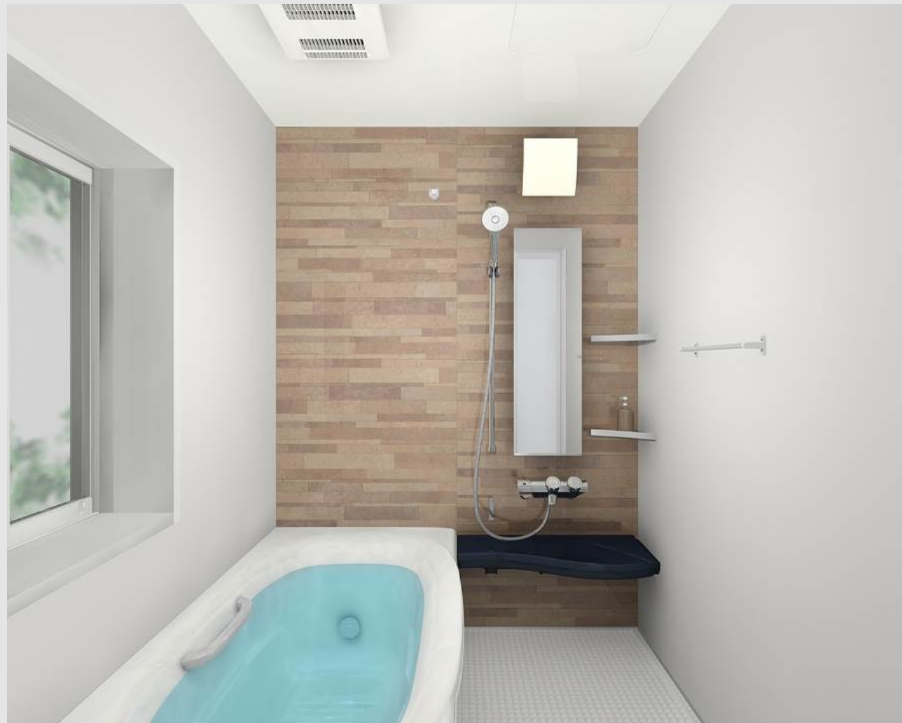
CG合成によるイメージ画像です。