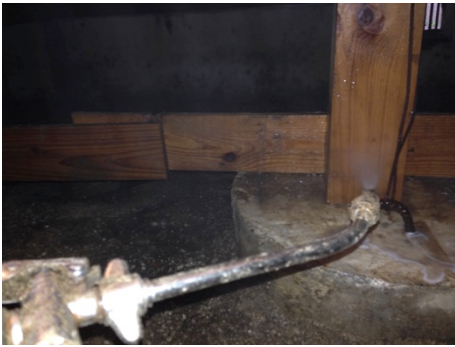
写真 3 床下木部処理