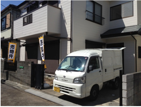
写真 1 既存住宅の防蟻工事は染みや汚損を考慮し無色薬剤を使用します。