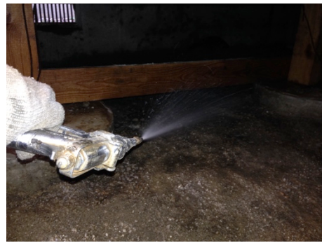
写真 4 床下土壌処理