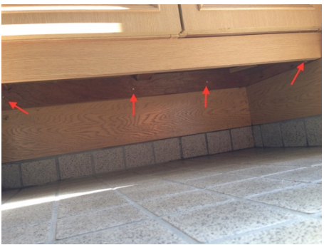
写真 5 玄関は床下から施工できないため下駄箱の下から薬剤を穿孔注入しました。